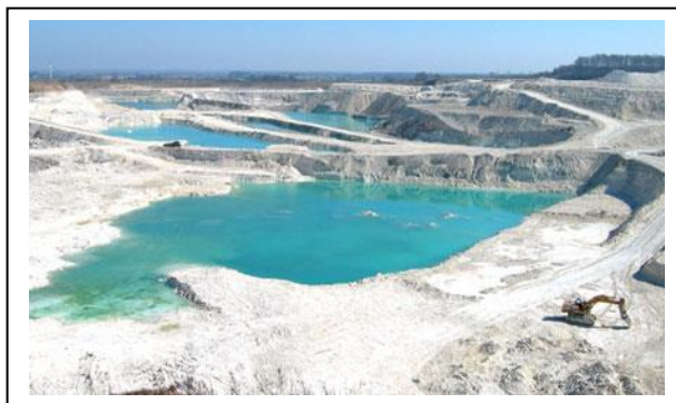
Udsigt over Faxe Kalkbrud set fra Danhostel Faxe